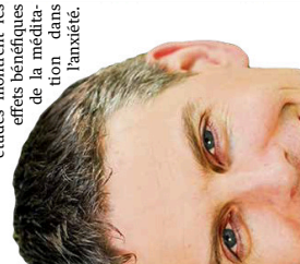
De nombreuses études montrent les effets bénéfiques de la méditation dans l'acupuncture sur les maux de dos -> page 11 | Dr Pierre-Yves Rodondi, DR

► Il existe encore un certain nombre de mystères concernant l'acupuncture, notamment comment elle agit exactement. Vouloir à tout prix valider totalement une méthode est probablement peu réaliste. Il faudrait plutôt se concentrer sur le fait de voir si les études permettent de valider une méthode par rapport à un problème de santé en particulier. Par exemple, de nombreuses études montrent les effets bénéfiques de la méditation de la méditation, notamment l'anxiété.