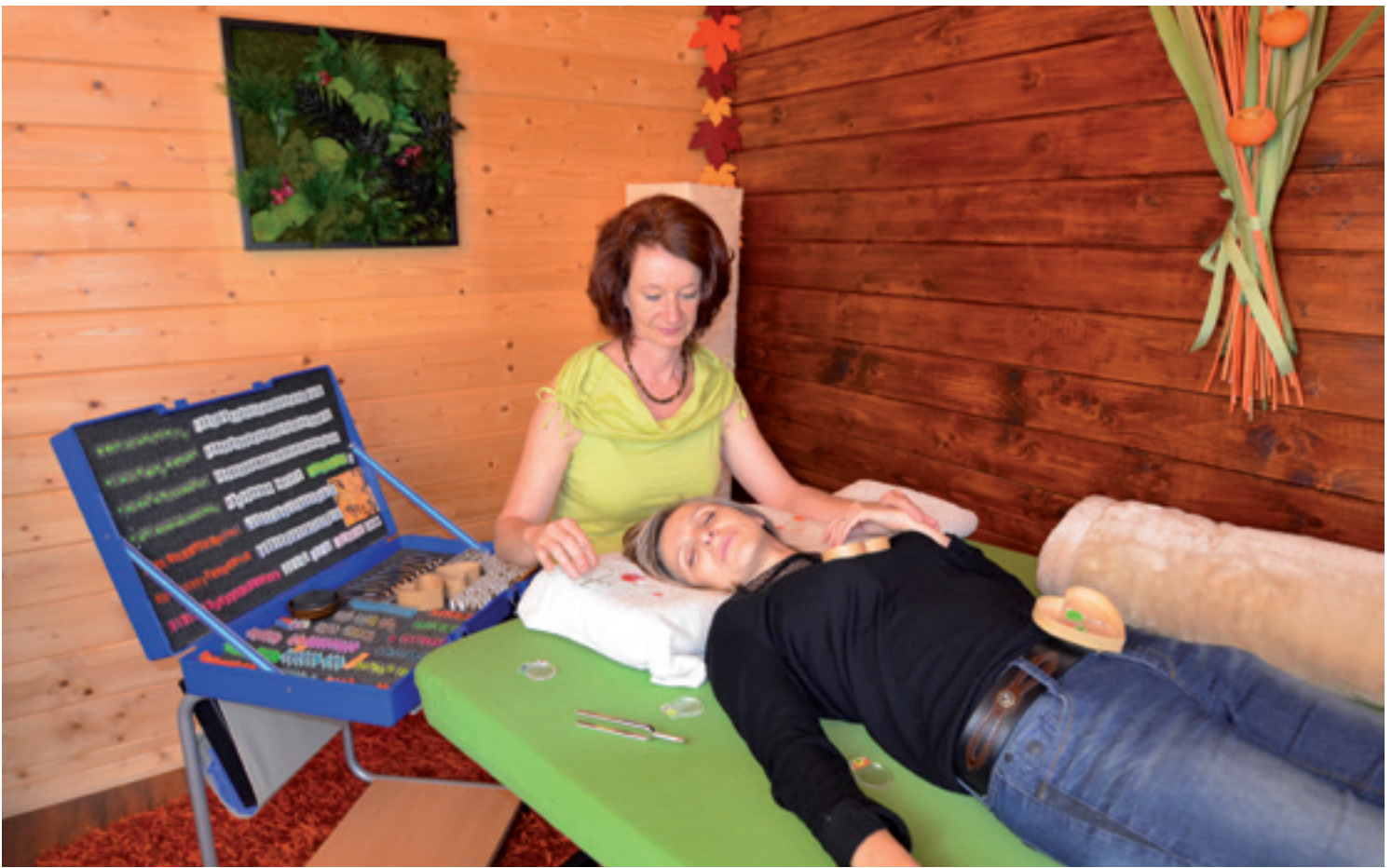
Concrètement, la «correction» des fréquences s'effectue à l'aide d'un ou de plusieurs diapasons.

successives qui l'ont menée là, et qu'est-ce qui au tout début a déstabilisé la personne?».