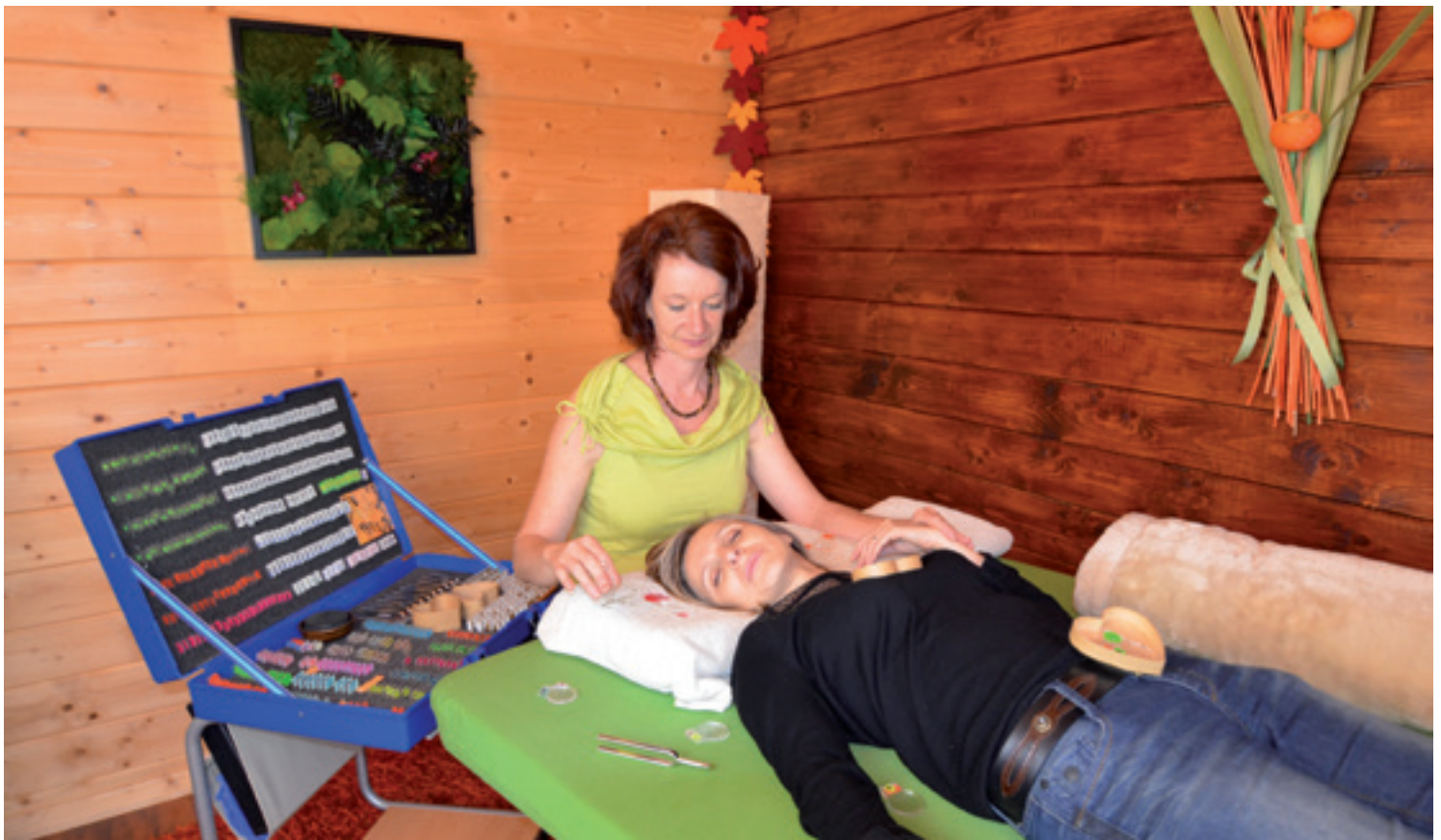
Die „Korrektur“ der Schwingungen wird in der Praxis mit einem oder mehreren Stimmgabeln durchgeführt

Auslöser, der die Person ganz am Anfang aus dem Gleichgewicht gebracht hat?“